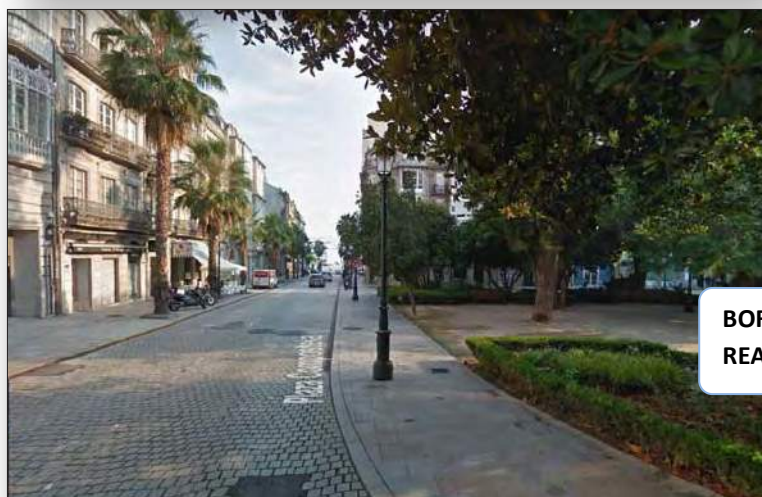
BORDEAR LA ALAMEDA HASTA VER LA ENTRADA DEL REAL CLUB NAUTICO DE VIGO AL FRENTE