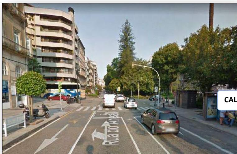
CALLE ARENAL Y AL FONDO LA ALAMEDA